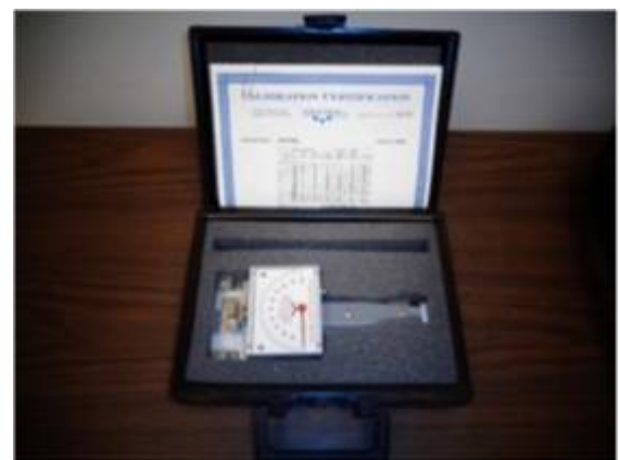
Messgerät mit Schutzhülle und Zertifikat

TO ORDER: Email: info@thomasklein.de , Tel +49 (0) 7153 37333 Fax +49 7153 38531 Thomas Klein, Daimlerstr. 13-15, DE73249 Wernau (Neckar) SEE OUR WEBSITE: www.Tensitron.eu or www.thomasklein.de